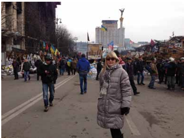
Marietta på Maidan innan stormen bröt ut!

inplanerade, med ministrar och presidenten. Vi var uppe tidigt och visste inte vad som väntade oss den dagen, en ödesdag med många döda.