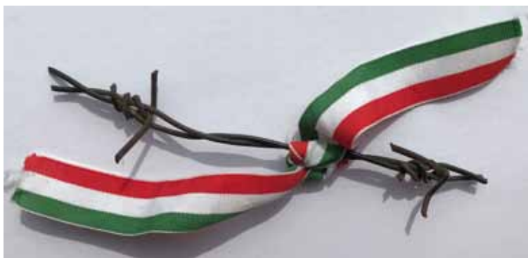
Gränstråd – en bild av järnridån.

I mars 1991 for jag och en riksdagskollega till Estland och Lettland för att med vår närvaro visa vårt stöd. Vi fick söka visum på sovjetiska ambassaden. Flygresan från Stockholm till Tallin tog mindre än en timme. Så nära ligger Estland, ett land präglat av svensk historia, som varit helt avskärmat från oss. Vid mitt första besök fanns det fortfarande sovjetiska trupper på gatorna i Tallin och någon månad tidigare hade de röda baskrarna intagit civildepartementet i Riga och skjutit ihjäl sju personer i parken utanför. För våra grannländer som varit fast