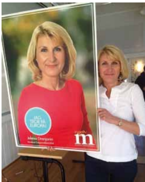
Självporträtt. Inför EU-valet 2019.

parådets kongress där man politiskt har uttalat sig tydligt om jämställd representation så har man inte gjort detsamma i Regionkommittén. Det vore naivt att tro att detta inte påverkar våra politiska dokument, våra yttranden, våra policyer som sedan återspeglar sig i beslut. Därför är den kvinnliga, politiska representationen oerhört viktig och den börjar faktiskt på den lokala nivån. Att få kvinnor engagerade i politiken är avgörande och börjar oftast på den lokala nivån.