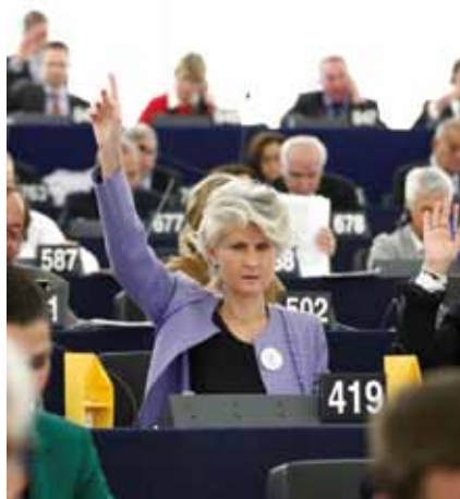
Omröstning – med bestämt uttryck.