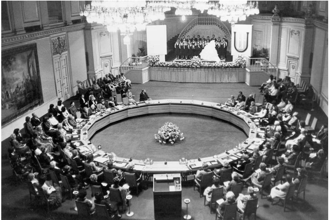
EFU:s 25-årsjubileum i Hofburg 1980.