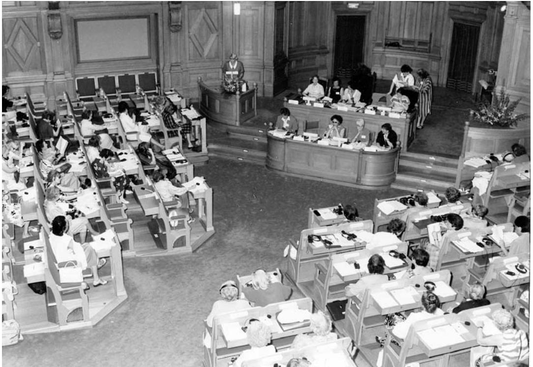
Rådsmötet 1986 i kammarsalen i Riksdagen.

talade om Norden och Europa, men huvuddelen av förhandlingarna ägnades åt en resolution att presentera FN.